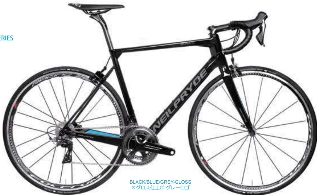
BLACK/BLUE/GREY-GLOSS ※グロス仕上げ グレーロゴ

単なるヒルクライムバイクとは言わせない剛性を持つ最軽量720gロード。クリテリウムにも耐える瞬発力と推進力。クライマーだけでなく、スプリンターをもうならせる強靱な走行性能。数多くの補強リブ（ガセット）、左右非対称のフレームワーク、世界最高水準の重量比剛性など、40年以上にわたるニールプライドの技術と執念の結晶。今年はさらに、BB部分とヘッドチューブの剛性を最適化し、さらなる進化を遂げた。軽量なだけでは勝てない。最後の瞬間まで踏み続けるあなたに、勝利をもぎ取る切り札となる唯一無二のバイク。それがBURA。