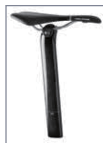
シートアングル可変シートポストが標準装備 (前後リバーシブル)