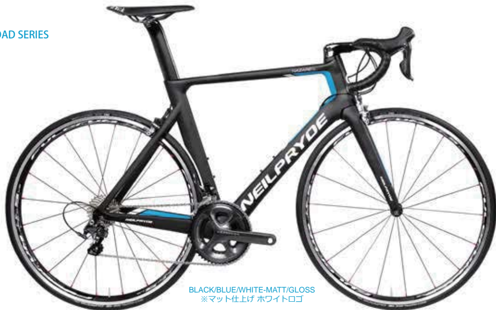
BLACK/BLUE/WHITE-MATT/GLOSS ※マット仕上げ ホワイトロゴ