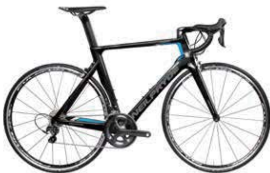
BLACK/BLUE/GREY-GLOSS ※グロス仕上げ グレーロゴ