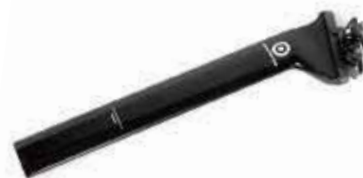
78° NAZARÉ1-2 SL TRI SEAT POST ¥19,800 (税別)

SEAT ANGLE : Adjustable seat tube angle up to 78 degrees SEAT CLAMP : Ritchey saddle clamp on monorail design WEIGHT : 0.24kg LENGTH : 350mm