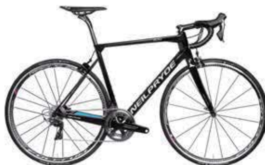
BLACK/BLUE/WHITE-GLOSS ※グロス仕上げ ホワイトロゴ